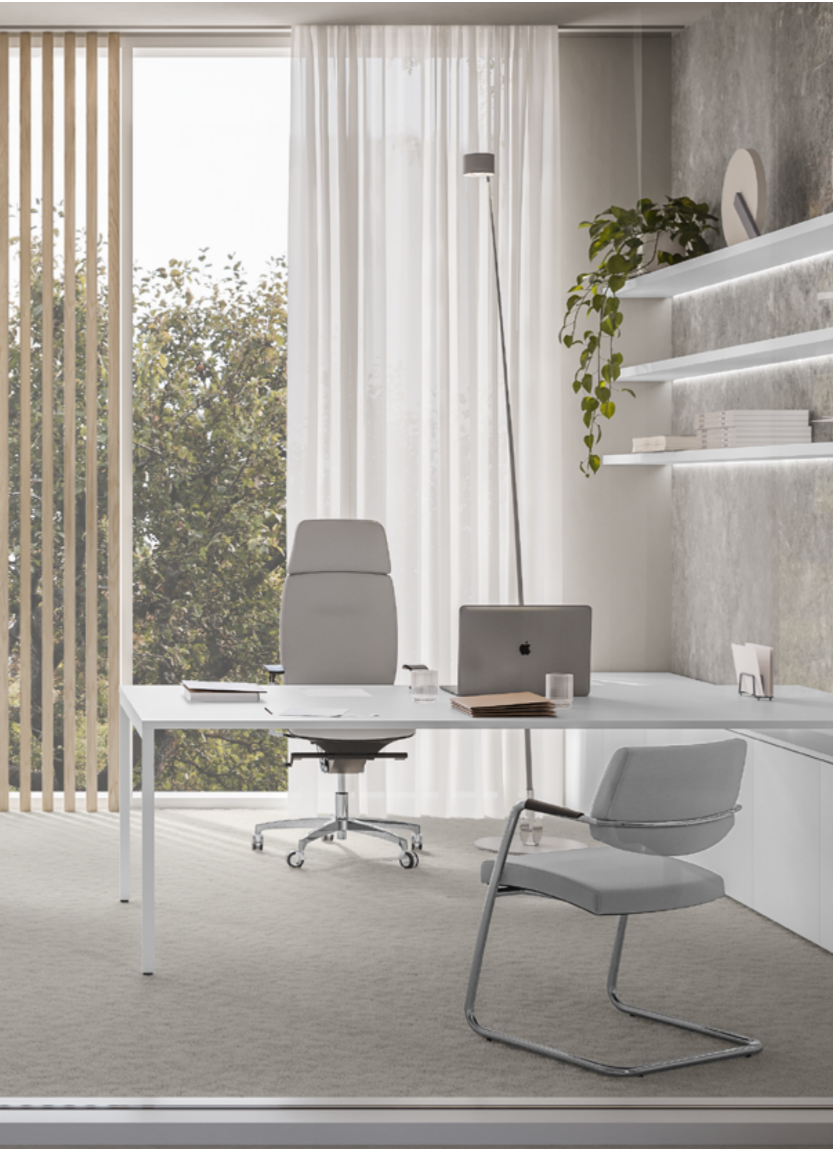
Spirit Executive Passe-partout Visitor